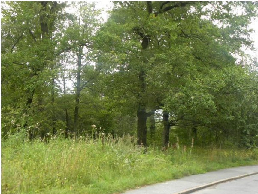
Solbergaskogen inom kv Månstenen, värdefulla och artrika träd med rödlistade arter.